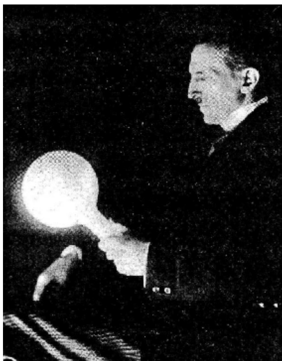
S laskavým svolením Daniela Dumycha