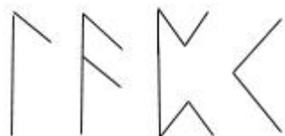
рис. 1 руны "LPAK"

Руны в талисманах могут применяться как по отдельности, так и в сочетании. Например, достаточно действенное сочетание (поскольку оно не является заклятием как таковым), способное усилить ваши психические способности; оно приведено на рис. 1.