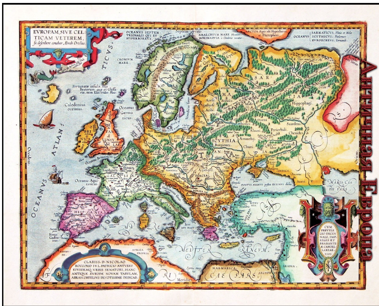
obr. 1 (klikni pro zvětšení)

V tomto úryvku je mnoho zajímavých momentů. Z nějakého důvodu každý automaticky mluví o Pilátu Pontském jakožto o římském prefektu v Judei. Problém je, že v prvním století n. l. žádná Římská říše nebyla a tím méně její nadvláda nad Blízkým východem. Existují na to početné důkazy, počínaje tím, jak nestoudně moderní "historici" padělali historii starověkého Říma! Není žádných pochyb, že ve starověku existovalo město Řím, ale neexistovala kolem něj žádná Římská říše! Abychom se přesvědčili o pravdivosti tohoto výroku, stačí se podívat na skutečnou mapu starověké Evropy, kterou Abraham Ortelius (1527-1598), světově proslulý a uznávaný středověký kartograf, zhotovil v roce 1595 (obr. 1).