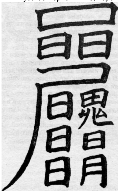
Образчик "ФУ", каббалистического знака, отгоняющего дурной сон

* Русское Чернокнижье, перепечатка Сахарова И.П. "Сказания русского народа". Изд. 1885, Москва, 1991.