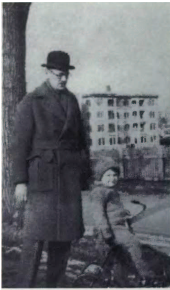
1922, Springfield, Massachusetts. Dr. Timothy Leary st. a autor ve věku dvou let.