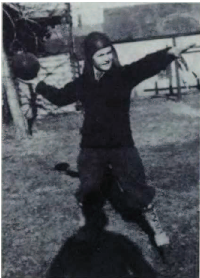
Podzim 1931, Springfield, Massachusetts. Autor sní o tom, že se stane slavným fotbalistou.