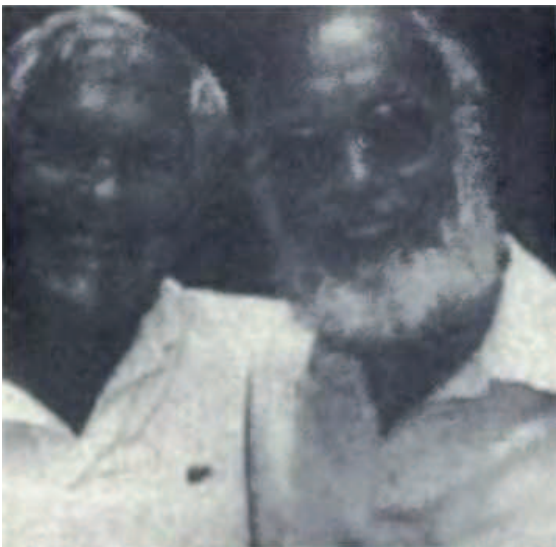
Léto 1982, Hollywood Hills. Přátelské setkání s Ram Dassem těsně předtím, než se částečně znovu vrátil ke své totožnosti coby Richard Alpert.