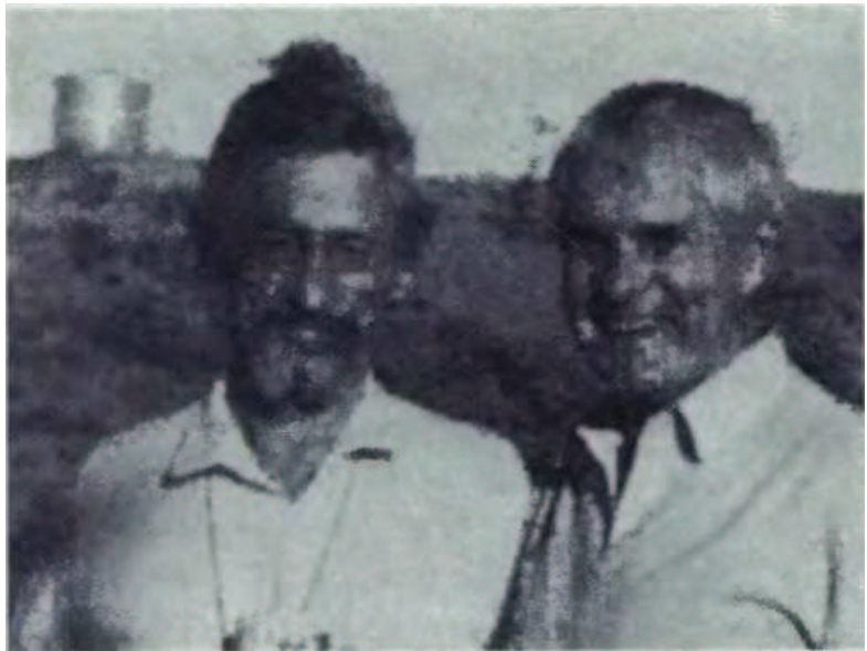
Podzim 1982, Malibu. Dr. John Lilly, průkopník bádání v lidském nitru, s autorem.