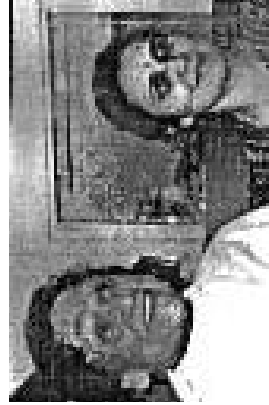
Šrí Gurudev Čítrabhanu se ženou