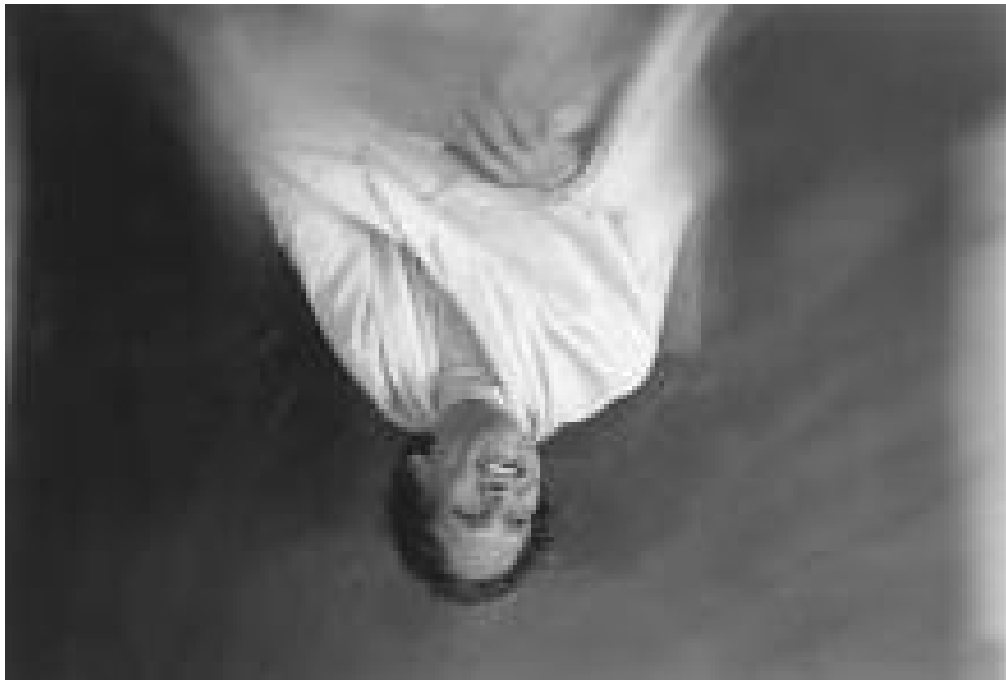
Šrí Gurudev Čítrabhanu