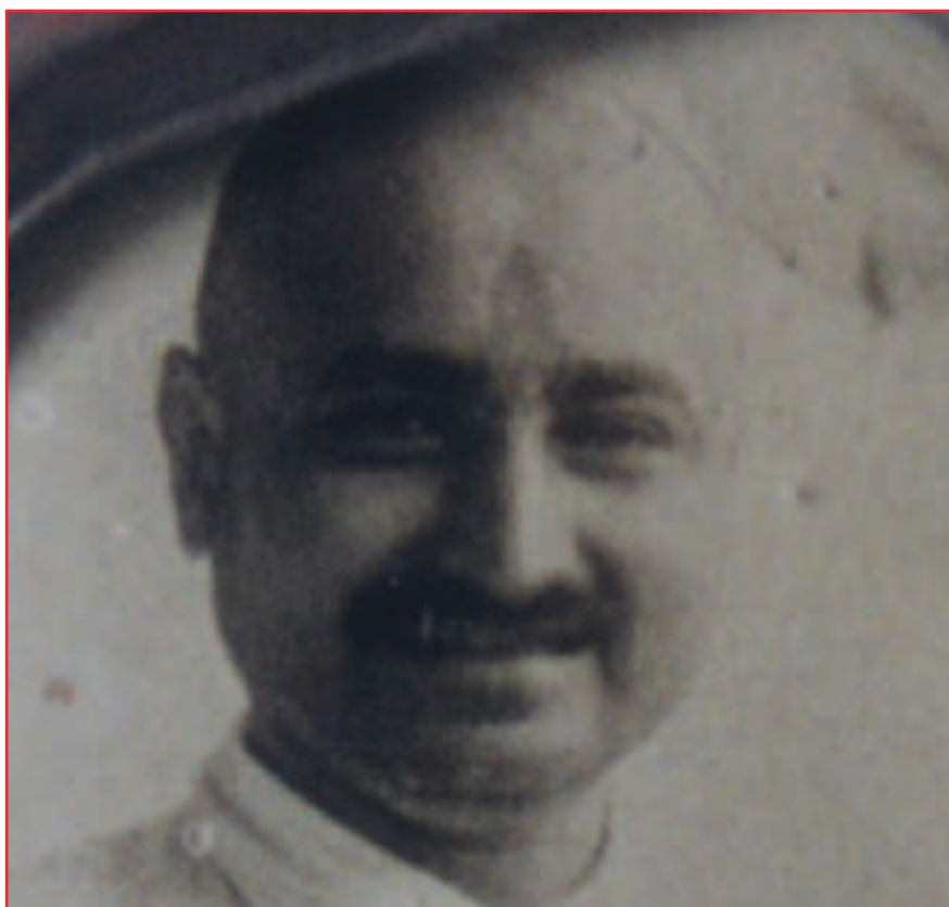
Śrī Siddharamēśwar Maharadž

Slunce je stálíce, i když se zdá, že obíhá kolem Země. Podobně Já je stálé, ale kvůli spojení s tělem prochází cyklem 8,4 milionů zrození a smrtí. Jakmile se setkáte se Satguruem, tak díky jeho pomoci uniknete ze spárů cyklu smrti a zrodu a také překročíte oceán světské existence (samsára). Toto Já, které je ve skutečnosti Paramátman, vytváří koncept 'Já jsem tělo', nachází zalíbení ve všech sklonech těla a užívá si radosti či snáší utrpení. Individualita si poté, co se setká se Satguruem, může vybrat buď stezku vedoucí k Osvobození, nebo cyklus zrodů a smrtí. Iluze není nic a ten, kdo se zřekl 'tělesného vědomí' ji snadno dokáže překonat. Avšak pro toho, kdo si je 'tělesně vědomí', je obtížné transcendovat omezení iluze. Ten, kdo věří, že Satguru je Paramátman, kdo uctívá