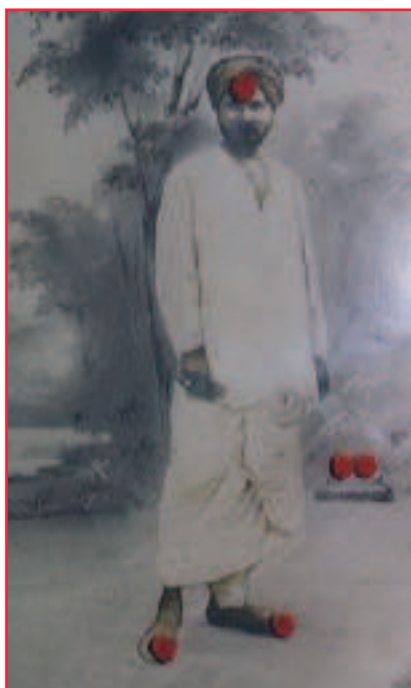
Šrí Siddharaméšwar Maharadž

Džňánin nedostane nikoho do potíží. Nestará se o záležitosti druhých lidí, a ani se nenechá vtáhnout do zbytečných diskuzí. Nejprve sebe naučte tomu, co chcete učit druhé. Buďte si neustále vědomi své základní povinnosti pochopit přirozenost Já a zůstaňte nedotčeni podobně jako je Já ničím neznečištěno. Měli byste zjistit, v jakém způsobu jste