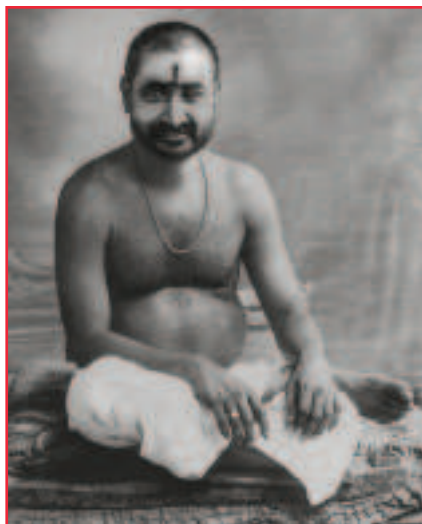
Šrí Siddharaméšwar Maharadž

individualitu pronásleduje myšlenka 'já jsem tělo', pak lze říci, že osudem individuality je být zasažen cyklem zrození a smrtí. Každý by měl realizovat Já. Neznalost svého Já je sebevraždná.