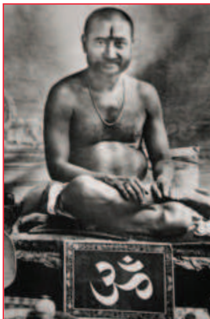
Šrí Siddharaméšwar Maharadž

Muž a jeho žena ve výše uvedeném příběhu reprezentují Já (Puruša) a tělo, projev (Prakrti), které jsou brány jako jedna jediná bytost, která dá vzniknout prvotní iluzi neboli pocitu ´já jsem´. Potom přichází Pán Višnu, vědomí, následované Pánem Brahmou, tedy ´vnitřní myslí´. Jako další přichází intelekt, který je složen ze stejných podílů kvalit radžasu a tamasu. Nejstarší vnuk je Šiva (Rudra), jenž je nevědomostí, zapomnětlivostí. Je to díky této nevědomosti, že člověk umře, aniž by našel řešení oněch neobjasněných hádanek. To se přihodí všem lidským bytostem. Člověk umírá důsled-