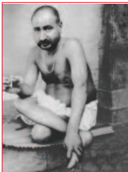
Śrī Siddharamēśwar Maharadž

touha, žízeň, hlad, spánek, lenost, otupělost, zívání a zahálčivost. Pokud během uctívání Gurua dojde k důvěrnému vztahu, pak žák zapomene na sebe sama (džívovství). Uctívání je prováděno prostřednictvím zpěvů, kdy se chvalořečí Sadguru (bhadžany a kirtany) a prostřednictvím kontempace na Něho a Jeho učení.