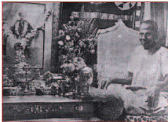
Šrī Siddharaméšwar Maharadž a Šrī Nisargadatta Maharadž

vené slovo para značící 'za') a sanga (společnost či sousedství). To znamená, že bez sousedství (společnosti) světců si nikdy nebudete užívat společnosti 'para' ('za'), které je jinak mimo náš dosah. Pán Ráma a Pán Krišna, kteří jsou nyní považováni za Bohy, nebyli původně Bozi, ale Mistři.