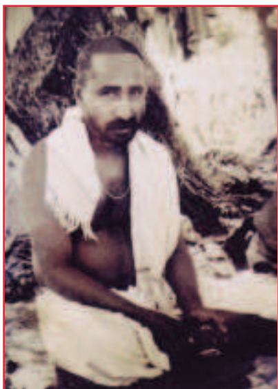
Šrí Siddharaméšwar Maharadž

Vzduch je jeden z pěti složených elementů našeho těla. Tento vzduch je stejný jako vzduch, jenž je v makrokosmu. To vysvětluje, že projev Pána a hrubé tělo individuality jsou jedno a totéž. Obojí vlastní stejných pět elementů.