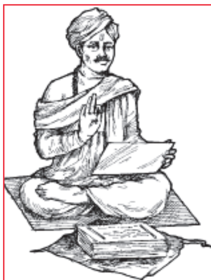
Šrí Eknath Maharadž

Jestliže jsme v minulosti jiným způsobili potíže, budeme muset zcela jistě sklízet plody. Jaké je vaše přání, takové jsou plody. Lidé, přející zlo a nemoci druhým, musí podle toho trpět. Džňánin říká, že tělo bude muset snášet plody svých činů. Ten, kdo přeje druhým vše dobré, je vždy šťastný. Říká: 'U Boha jsou si všichni rovni' a podle toho se k lidem chová. Jestliže si vypěstujete tento postoj, budete nesmírně šťastni. Jestliže jsme k druhým dobří, budou na oplátku dobří k nám.