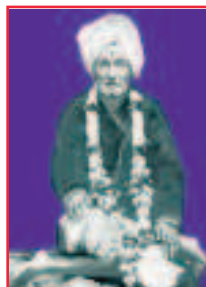
Šrí Bhausahab Maharadž