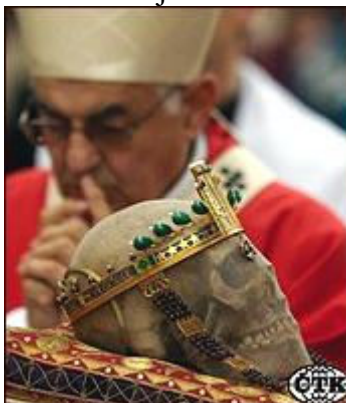
Kardinál Vlk se modlí nad lebkou svatého Václava

Václavovo zavraždění mělo podle Kristiánovy legendy připadnout na den sv. Kosmy a Damiána, který se slavil 28. září. Dnes na toto datum připadá i státní svátek. Zastánci alternativních verzí namítají, že je možné, že Kosma a Daimán byli spíše patrony kostela, před nímž byl Václav zabit než označením data, nepodařilo se však prokázat, že by v Boleslavi existoval v 10. století kostel tohoto jména.