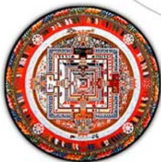
Chart of the Elements in a Kalachakra Sand Mandala