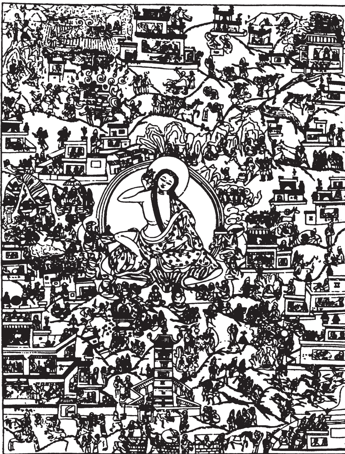
Tato tibetská kresba znázorňující Milaräpův život byla přetištěna z anglického originálu