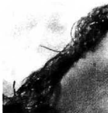
Obr. 14: Síť nanovláken.